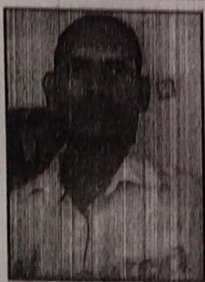
Deed Writer Bokaro Chas