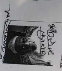
भारत प्रसाद आ।नं. 10-7/05