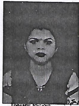
दस्तावेज निषेक नं० १११/०२ मैदिनीनगर पलायु