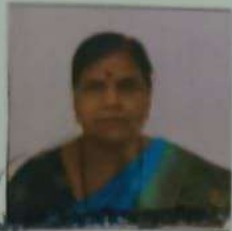
Advocate No. 761/89