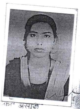
प्रकृत असा नान- 120