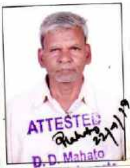
Civil / S.D.O Court Ghatsila

माता मम वर सोनी गॉड पालिका 20... अर्थात् के लिए