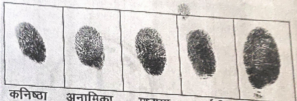
कनिष्ठा अनामिका मध्यमा तर्जनी अंगूठा