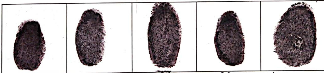
कनिष्ठा अनिमिका मध्यमा तर्जनी अंगूठा

प्रमाणित किया जाता है कि पहचानकर्ता के बांके हाथ का पांचों अंगुलिओं का दाप मेरे समक्ष लिखा गया।