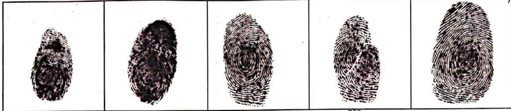
कनिष्ठा अनिमिका मध्यमा तर्जनी अंगूठा

प्रमाणित किया जाता है कि लेखकधारी के बांके हाथ का पांचों अंगुलिओं का दाप मेरे समक्ष लिखा गया।