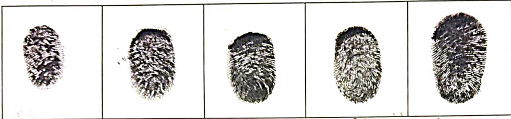
कनिष्ठा अनामिका मध्यमा तर्जनी अंगूठा

05.01.2024 10:01 अध्यापक से प्रथम निवृत्तन का प्रमाण सिमडेगा में लेखाकारी वा लेखधारि का तनवी प्रमाण ही प्रमाण ..... लेख प्रमाण प्रमाण ..... प्रमाण ..... के सिवा प्रमाण प्रमाण द्वारा प्रमाणित है। प्रमाण प्रमाण प्रमाण प्रमाण प्रमाण प्रमाण प्रमाण प्रमाण प्रमाण प्रमाण प्रमाण प्रमाण प्रमाण प्रमाण प्रमाण प्रमाण प्रमाण प्रमाण प्रमाण प्रमाण