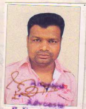
E. No. 1627/1992

अनुसूची 1 के अधीन... काश्तकारी एक्ट की धारा 46A के अधीन... का प्रभाव है और इण्डियन स्टाम्प एक्ट-1899... की अनुसूची 1 का 1 क के अधीन... यथावत स्टाम्प लगाया गया है। अथवा टिकट... नशी में विद्यमान है या स्टाम्प - शुल्क अपेक्षित... नहीं है।