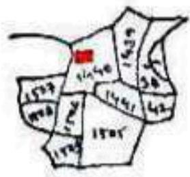
Scale - 16" = 1 Mile