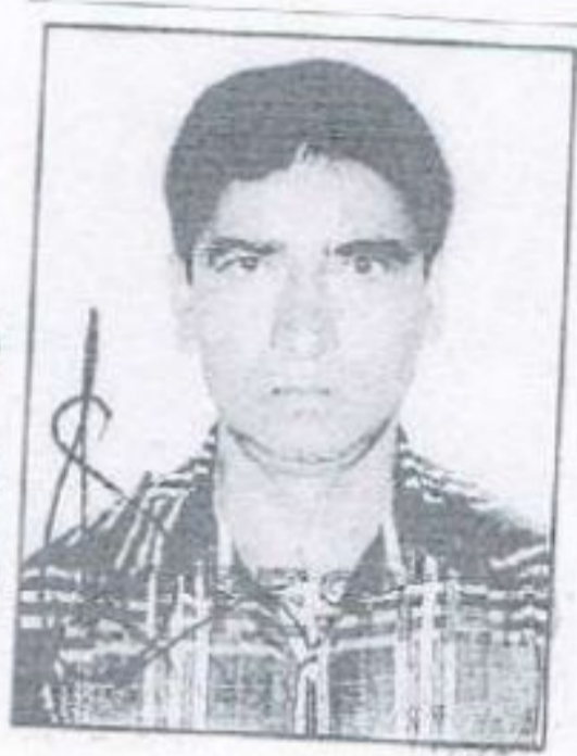
Advocate ENR No.-589/200

अचल अधिकारी के प्राप्त सूची अनुसार दस्तावेज में वर्णित भूजा नम्बर के नया खाता न निर्दिष्ट खाते से बाहर है